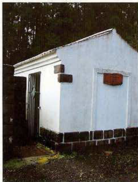
2 - INSTALAÇÕES SANITÁRIAS