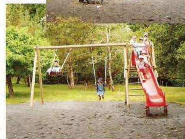
5 - PARQUE INFANTIL