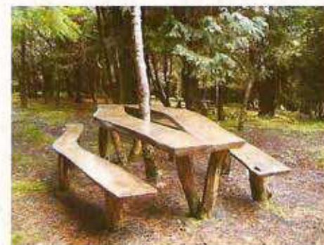
4 - MESAS