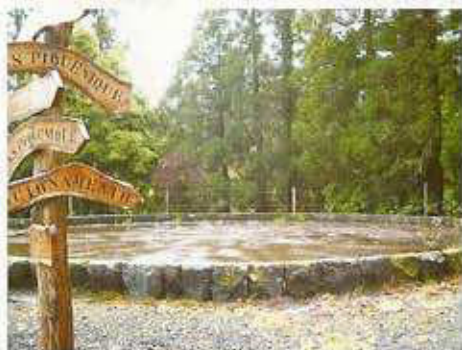
1 - EIRA