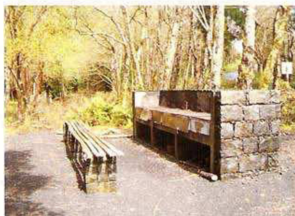
3 - GRELHADORES